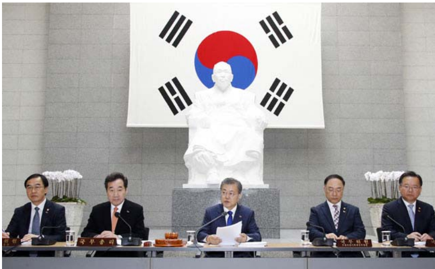
문재인 대통령은 지난 2월 26일 서울 용산구 백범기념관에서 국무회의를 열었다.

1960년 출생. 서울대 경제학과 졸업, 同 대학원 경제학 박사 / 낙성대경제연구소 연구위원, 대한민국역사박물관 학예실장 역임. 現 이승만학당 교사 / 저서 《대군의 척후》 《고도성장시대를 열다》