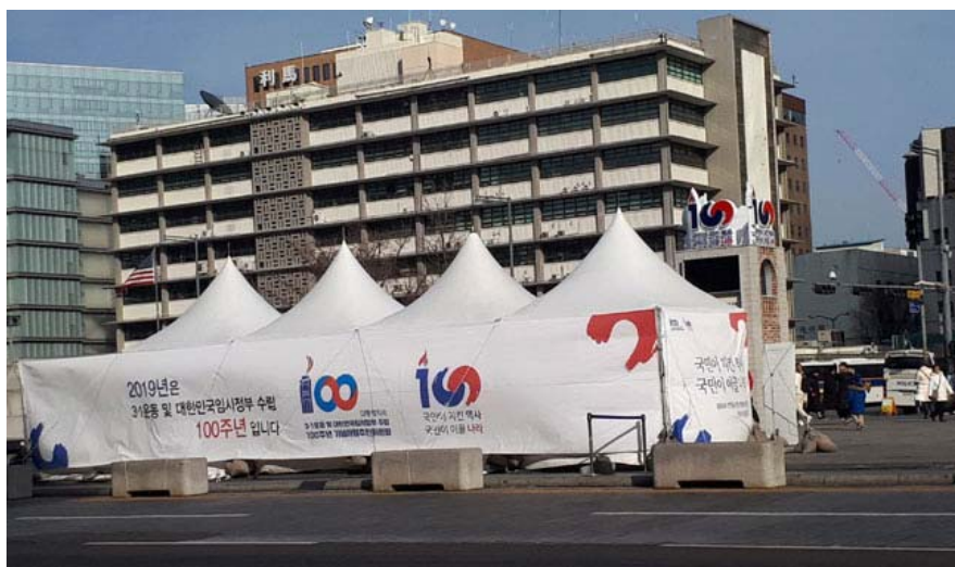
서울 광화문광장에 있는 3·1운동 및 대한민국임시정부 수립 100주년 기념 홍보 시설물. '건국 100주년'은 사라지고 '임시정부 수립 100주년'이 등장했다.

한국인은 ‘대한민국이 어떤 정신을 계승했는가’를 보는 대신, ‘대한민국이 누구를 계승했는가’를 생각하기 시작했다. 임정 법통론을 처음 주장한 역사학자는 1919년 임시정부에 집결한 좌우의 광범위한 독립운동 세력을 염두에 두었고, 이는 1948년 성립한 대한민국을 지지하려는 생각이었다. 그러나 계급혁명 지향의 민중사학과 배타적인 민족근본주의 사학이 횡행하면서, 현재 임정 법통론자들은 김구의 임시정부를 존송하며 1948년의 잘못된 계승을 이야기하는 모순과 혼돈에 빠졌다.