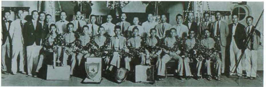
『양정 환영의 밤』 행사에 참가한 손기정과 여운형(1934.)