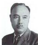
여운형(呂運亨) 1885~1947 경기도 양평 건국훈장 대통령장(2005) 대한민국장(2008)