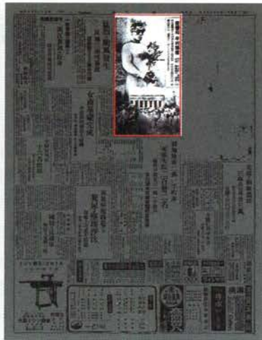
『영예의 우리 손군』 『동아일보』(1936. 8. 25.)