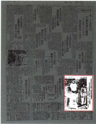
『머리에 빛나는 월계관, 손에 굳게 잡힌 권도목』 『조선중앙일보』(1936. 8. 13.)