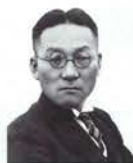
송진우(宋鎭禹) 1890~1945 전라남도 담양 건국훈장 독립장(1963)