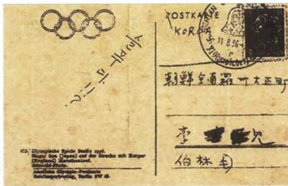
손기정이 친구에게 보낸 엽서(1936. 8. 11)

한편 8월 25일자 『동아일보』 일장기 말소 기사가 일제에 의해 검열되면서 『조선중앙일보』 기사도 수사되어 신문 정간 위기를 맞이하였다. 이러한 상황에서도 『조선중앙일보』 사장 여운형은 민족의식을 고취시키는 기사 보도를 지지하며 언론인으로서 민족 여론 대변에 힘썼다. 정부는 여운형의 공훈을 기리어 2005년 대통령장·2008년 대한민국장을 추서하였다.