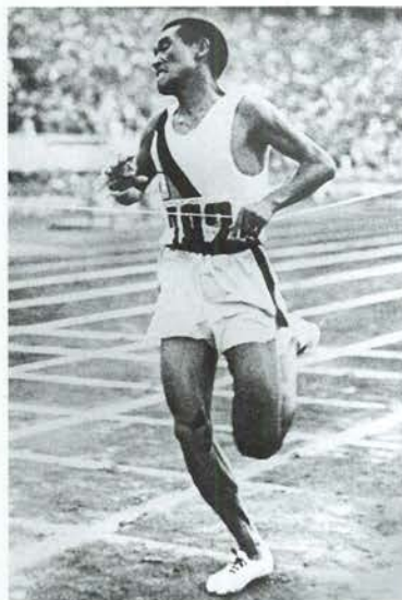
결승선을 통과하는 손기정(1936. 8. 9)

올해 85주년을 맞은 이른바 '일장기 말소사건'은 일제의 언론 탄압이 거세지는 시점에 민족의 자부심을 고취시켰으며 언론의 항일정신을 보여주었다.