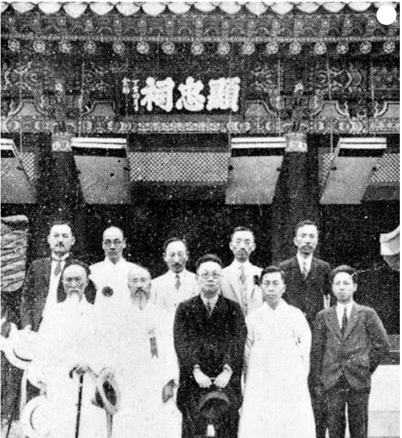
1932년 6월 5일 국민성금으로 중건된 현충사 앞에서 당시 동아일보 사장 고하 송진우(앞줄 가운데)와 논설위원 위당 정인보(뒷줄 왼쪽에서 두 번째), 훗날 대한민국 초대 대법원장을 지낸 가인 김병로(뒷줄 왼쪽에서 네 번째)가 기념사진을 찍었다.

문화재청, ‘충무공 유적보존회’ 기록물 성금편지 등 4254점 문화재 등록 예고