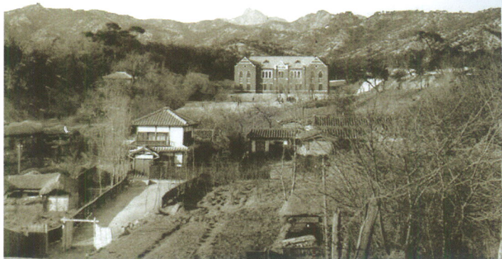
1917년 11월 북악산 자락 아래에 들어선 중양학교 본관(가운데)은 민족운동가들을 양성하는 장안의 명소가 됐다. 본관 오른쪽 아래로 3·1운동을 모의한 숙직실이 있었다.

그들 가운데 당시 중양학교 교장이던 고하는 중양학교 숙직실에서 일제 당국에 검거되어 경찰수사를 받았다. 그 과정에서 고하는 혹독한 고문을 당했으나, 함구로 일관하며 꺾끗하게 버텼다. 경성지방법원 검사국의 취조서(1919년 4월 18일), 경성지방법원 예심부의 예심결정서(1919년 8월 1일), 고등