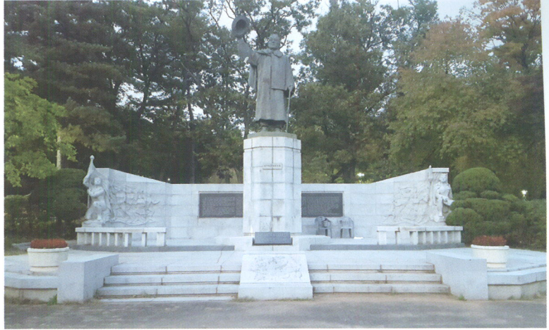
서울시 광진구 서울어린이대공원에 있는 송진우 동상과 부조 등 기념물

로 '자유주의적 공화주의'를 제시했다고 지적하고, 그것은 "건국 이후 한국의 가장 강력한 자유민주주의 담론과 세력으로 자리 잡았고, 급진공산주의와 우파독재에 대한 가장 체계적인 담론이자 운동이었다"라고 부연했다. 특히 고하가 제시한 "자유주의 또는 자유민주주의는 훗날 반독재투쟁과 4월혁명의 골간 정신이었다"라고 단정하고, "북한의 공산독재와 이승만·박정희·전두환 정부의 권위주의 정부를 상념할 때 한국에서 이들 자유주의 그룹이 민주주의 발전에 끼친 영향은 결정적이었다"라고 논평