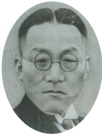
고하 송진우(1889~1945,)

다시 구속되어 3개월에 걸쳐 복역함으로써 일제강점기에 두 차례에 걸쳐 투옥된 기록을 남겼다. 고하의 항일정신이 이처럼 투철한 것을 알고 일제는 패망을 앞두고 고하를 비롯한 국내의 민족지도자들을 회유하거나 살해하려 하였다. 고하는 청병하면서 칩거하는 것으로, 특히 조선총독부의 치안권 이양제의 교섭에 일절 응하지 않는 것으로 맞섰다.